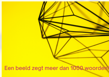
Een beeld zegt meer dan 1000 woorden!

Opdrachten die op verschillende manieren uitdagen het verhaal te vertellen. Bijvoorbeeld een storytelling opdracht of de opdracht 'Een beeld zegt meer dan 1000 woorden!' waarin docenten gevraagd wordt een foto te maken van hun innovatieve omgeving.